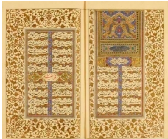
Manuscrito persa de 1894 de la obra El jardín amurallado de la verdad , Hadīqat al Haqīqa , de Hakim Sanai .

La obra más conocida de Sanai es el Hadīqat al Haqīqa va shariat at tariqa o El jardín de la verdad y la ley del sendero espiritual , comúnmente abreviado como El jardín amurallado de la verdad , si bien en los primeros manuscritos presentaba los títulos alternativos de Fakhrī nama (llamado así en referencia a Fakr-al-Dawla , uno de los títulos honoríficos del sultán Bahrām shâh ) e Ilahī nama o Ilahiname , Libro divino o Libro de Dios (denominación con la que Rumi conoció esta obra). [2][3][14]