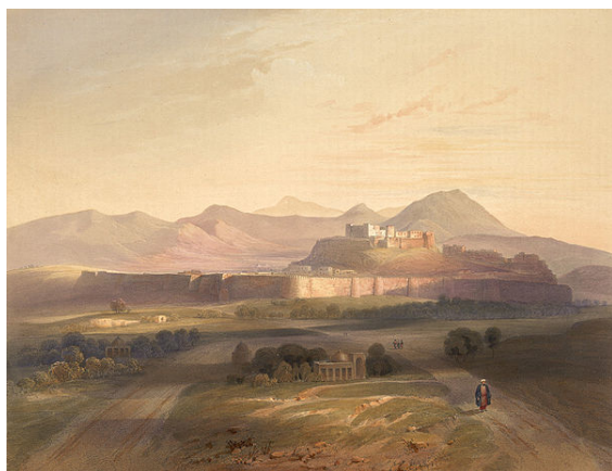
La antigua Gazni, ciudad de Hakim Sanai, en una litografía del siglo XIX.

No es mucho lo que se conoce de los primeros años de vida del sabio ( hakim en árabe) Sanai , pero el hecho de que hayan llegado hasta nuestros días varias de sus obras, ha ayudado a realizar un esbozo de su trayectoria vital siendo, de hecho, uno de los poetas persas sufíes que mejor se conoce del medievo .